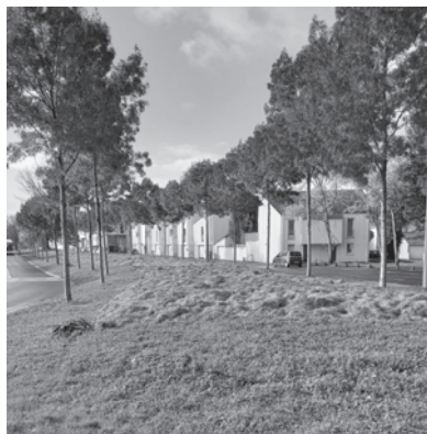
Allée de l'Embellie

Saint-Joseph se verdit : - Rue du Haut-Launay (en haut de la rue du Millau) : "désimpermabilisation" au