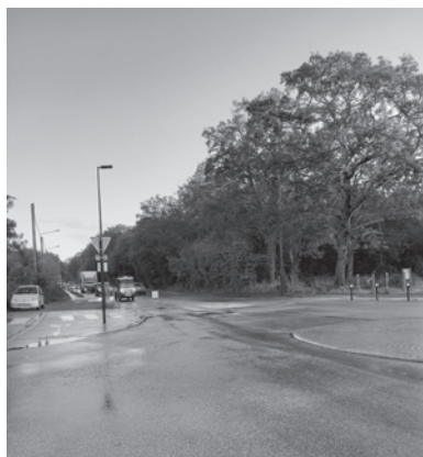
Route de Carquefou

Réaménagement des voies de circulation (suite) : Un chantier doit démarrer début novembre : poursuite du recalibrage de la route de