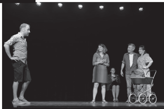
représentation à Festiv'ALPAC juin 2023