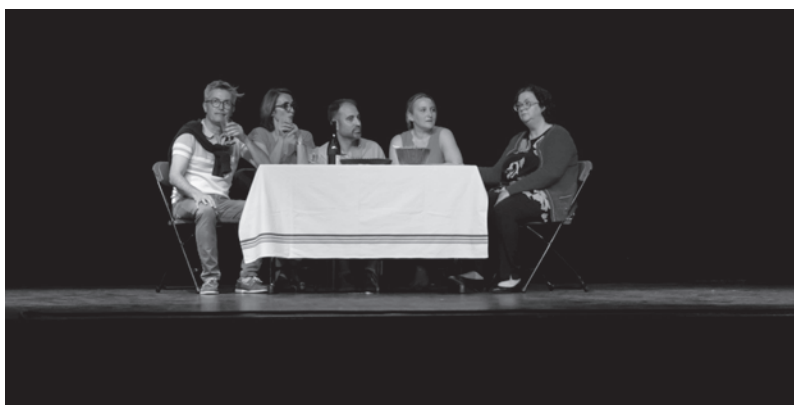
représentation à Festiv'ALPAC juin 2023