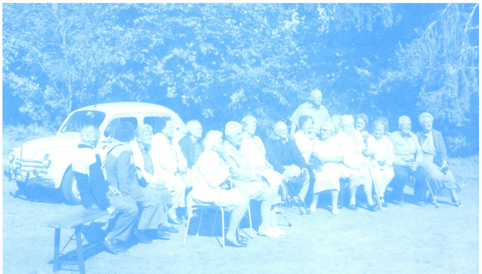
Les 60 ans des Castors

Le dimanche 25 septembre, nos Castors fêtaient le soixantième anniversaire du démarrage du chantier, en novembre 1951. 59 courageux allaient bâtir de leurs mains leurs 59 maisons. Aujourd'hui, "l'esprit Castors" existe toujours, chacun a pu s'en rendre compte par la chaleureuse ambiance qui régnait au cours de la fête ! À cette occasion, un bel album-souvenir a été réalisé par la fille d'un de ces premiers Castors.