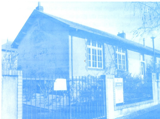
Les classes disparues de l'école publique

Depuis 1833 (loi Guizot), les communes devaient entretenir des écoles primaires pour les garçons, et depuis 1850, des écoles de filles. On ouvrit une école de garçons en 1850 dans une dépendance du presbytère, puis une école de filles en 1854 (l'école actuelle, rue du Bèle).