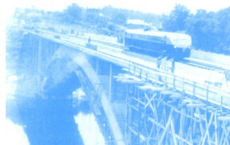
Une Bugatti passant sur le pont de la Jonnelière en août 1948.

► Le pont de la Jonelière va être muni de deux passerelles piétonnes ; côté sud (accès par les escaliers), elle devrait être ouverte en juillet 2011 ; côté nord, elle sera utilisable par les piétons, les cyclistes et les cyclomotoristes (ouverture : fin 2011). Deux voies ferrées sont prévues, l'une dès maintenant pour le tram-train Nantes - Châteaubriant ; l'autre, plus tard, pour la liaison ligne 1 - ligne 2 du tramway.