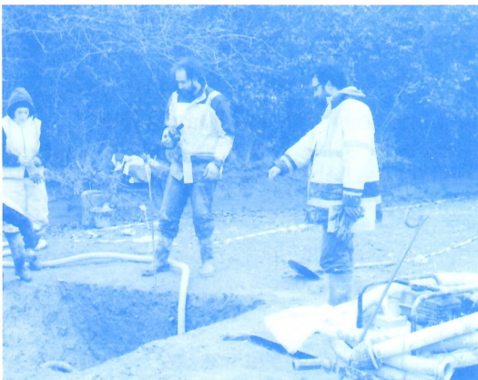
Archéologie près du Bois-Hue

Depuis la fin de l'automne, une nouvelle tranche des fouilles archéologiques préventives est en pleine activité. Elle concerne trois emplacements : à l'entrée du chemin des Pâtis (future rue des Grands Pâtis), un chantier prolonge celui des arrières du manoir de Porterie, où l'on avait découvert un étonnant réseau de canalisations souterraines maçonnées. Près du château du Bois-Hue, les premières fouilles avaient laissé deviner les vestiges d'un village gaulois, les seuls vestiges de l'Âge de Fer trouvés jusqu'à présent sur la commune de Nantes ; et plus près de la route de Saint-Joseph, les traces d'une maison forte médiévale vont être explorées.