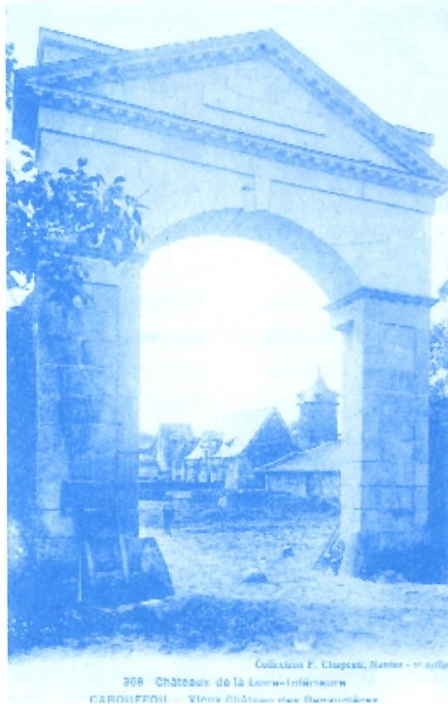
Les Renaudières vers 1900

public. En face, sur la rive chapelaine, le château de la Gâcherie se mire dans le lac. On arrive bientôt à l'auberge du Vieux Gâchet. Sur la colline, derrière l'auberge, s'élevait jusqu'en 1940 un moulin à vent. Avec l'auberge, ce fut longtemps le fief de la famille Vié.