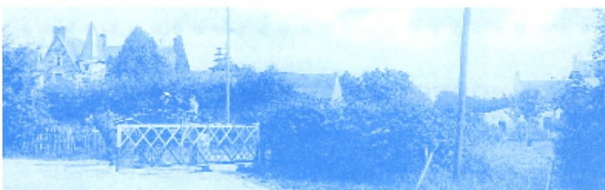
Le passage à niveau du Ranzay il y a 100 ans. À gauche, le manoir de Clermont-Ranzay (mairie-annexe), avec ses bâtiments agricoles ; tout à droite, c'est peut-être le Café du Rêve ? Il avait été ouvert en 1908.