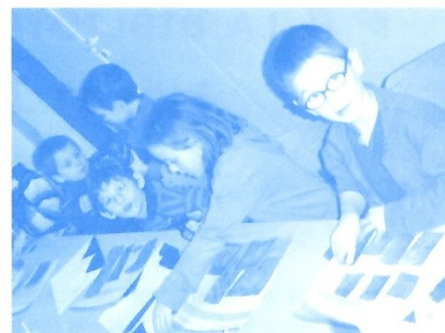
L'atelier des enfants

Le tableau reste exposé à la bibliothèque jusqu'à ce qu'une nouveauté prenne sa place.