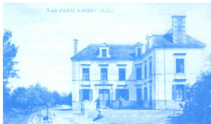
Le petit Gâchet vers 1900