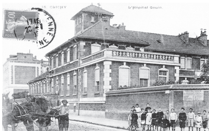
L'hôpital Goüin, à Paris

Quels souvenirs ont laissé les Goüin à Nantes ? Bien peu, sinon aucun. Quelques pages du livre d'Yves Rochongard (Capitaines d'industrie à Nantes au 19ème siècle), et dans des revues spécialisées d'archéologie industrielle... Qui sait encore qu'ils ont possédé, à l'époque de la Restauration, le château de la Gaudinière ? À Paris, les ateliers Goüin n'existent plus ; Ernest Goüin a donné son nom à une petite rue, puis à un square, situés à l'emplacement de l'usine. L'hôpital Goüin, à proximité, est toujours en activité ; il a été construit