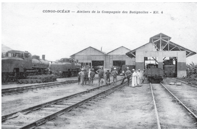
Les ateliers des Batignolles au Congo, les locomotives à gauche, ont probablement été fabriquées à Nantes.

La Société Ernest Gouïn devient une grande entreprise de travaux publics, qui obtient des chantiers dans le monde entier : Hongrie, Russie, Pologne, Brésil, Afrique. La colonisation bat son plein. Les puissances européennes se partagent « le gâteau », le reste du monde, qui regorge de