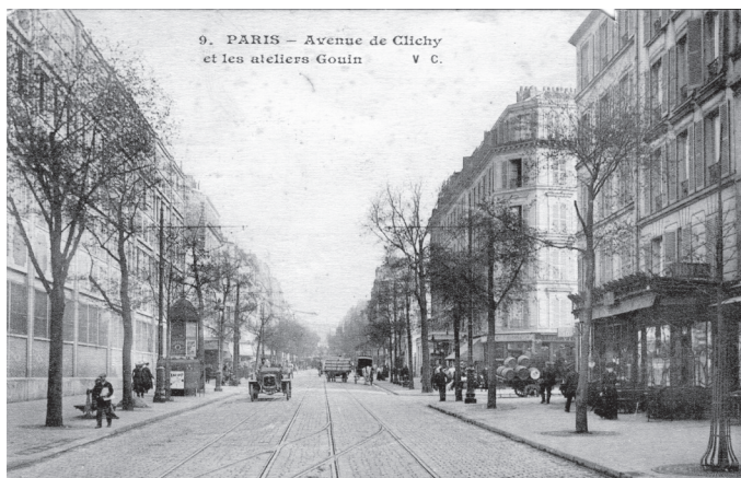
Paris, avenue de Clichy. A Gauche, Les ateliers Gouïn vers 1910

avancent les fonds. Il installe ses ateliers dans le quartier des Batignolles, à Clichy, une commune de la banlieue nord-ouest de Paris dont une partie va bientôt être annexée par la grande ville.