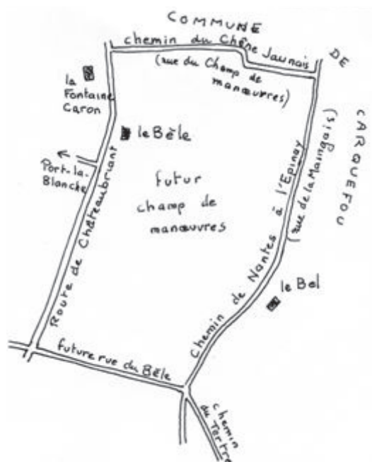
Le Bèle, d'après le vieux cadastre, vers 1835

Le nouveau terrain militaire du Bèle est un rectangle de 700 mètres est-ouest, 900 mètres nord-sud, entre la route de Carquefou et le chemin de la Maingais. Notre rue du Champ de Tir est alors un chemin bordé de haies et d'arbres qui aboutit à une grande cour bordée de baraquements qu'on peut situer entre la rue du Bèle et la nouvelle prison. On y installe un premier champ d'exercice où l'armée s'entraîne au lancer de grenades, au tir, ce qui ne va pas sans poser quelques problèmes avec les riverains, lorsqu'un projectile franchit les limites autorisées : les exercices se font à l'air libre, entre un abri pour les tireurs et une butte située à 300 mètres. L'armée