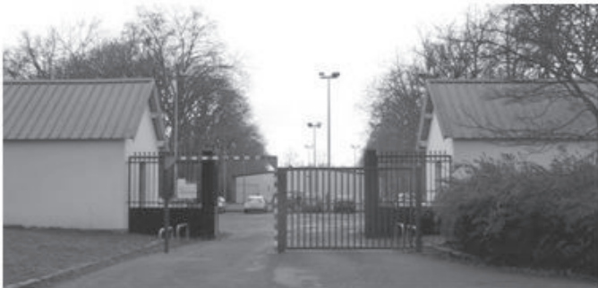
Boulevard de la Beaujoire, derrière le centre commercial, l'entrée du stand de tir, devenu un boulodrome. Devant le stand disparu, où sont garées les voitures, 81 Résistants ont été fusillés.

S'il est un lieu de sinistre mémoire, à Nantes, c'est bien ce vieux stand de tir. Les « hautes œuvres » étaient de vieille tradition, le long du chemin de la Maingais. Aux Archives Départementales, un gros registre énumère les droits, et les devoirs de justice, du seigneur de ces lieux au 17 ème siècle, l'évêque de Nantes : la Halvêque est la contraction du nom ancien, « la Haie-l'Évêque ». Lorsqu'un criminel était condamné par les juges de Monseigneur, c'est à la Halvêque qu'il venait subir sa peine. On peut même en préciser l'endroit : il y a quelques années, le long de la partie haute de la rue du Bèle, on a détruit la vieille poudrière, et un transporteur s'est installé sur son emplacement.