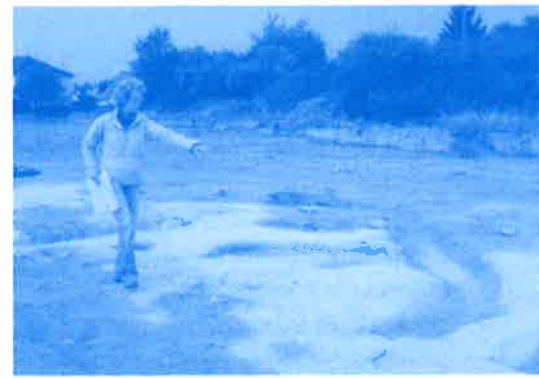
Vestiges de construction gallo-romaine (petit centre métallurgique ?)

Rappelons que des fouilles préventives, lors de la construction de l'autoroute vers 1990 , avaient déjà permis de découvrir les restes d'une ferme gallo-romaine près de la Bréchetière ; vers 1900, l'archiviste départemental Léon Maître signalait des débris nombreux de constructions de la même époque autour de l'Eraudière et des Salles ; et pour l'œil averti d'un archéologue, la sorte de chemin de ronde qui entoure le château du Fort et son parc est le signe évident d'une occupation militaire médiévale de l'endroit. Au fait, ce chantier de fouilles est-il vraiment la cause du retard pris par le démarrage des constructions ? N'arrangerait-il pas un peu les promoteurs, en cette période de " crise " ?