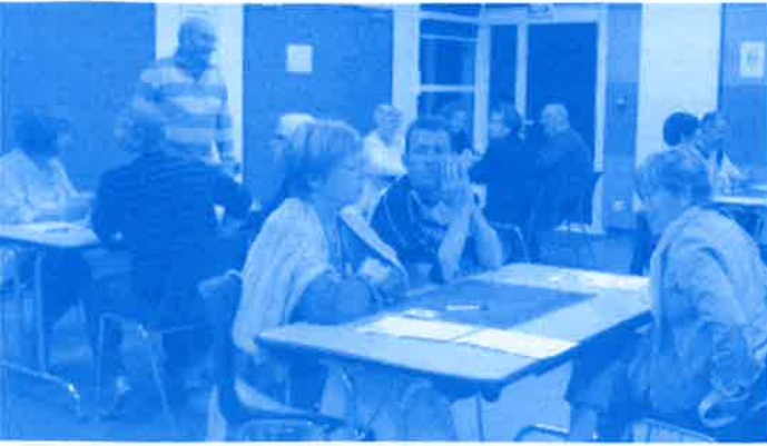
Autour d'une Belote

La commission fête de l'Alpac qui compte 10 personnes , et nous sommes tous des bénévoles , dynamiques et avec une bonne ambiance, a repris après 2 mois de repos bien mérité, avec son premier concours de belote qui a eu lieu le 26 sept. (liste des manifestations à venir dans l'agenda page 2). Les nouveaux bénévoles sont toujours les bienvenus pour 1 coup de mains , même pour 1h ou plus n'hésitez pas à venir nous rencontrer lors des manifestations ou téléphonez à Brigitte. À bientôt !