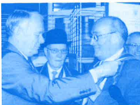
Trois maires réunis