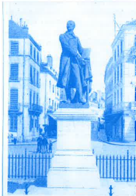
Statue de N. Niépce à Chalon-sur-Saône