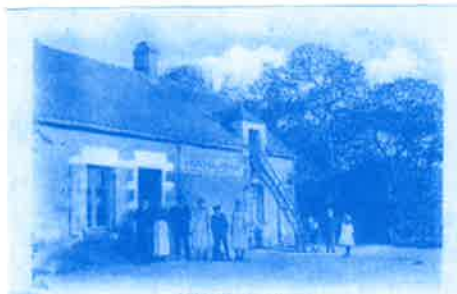
Le Café des Pêcheurs en 1900

élément du patrimoine de notre quartier ; on le croyait disparu définitivement, et le voilà qui revit.