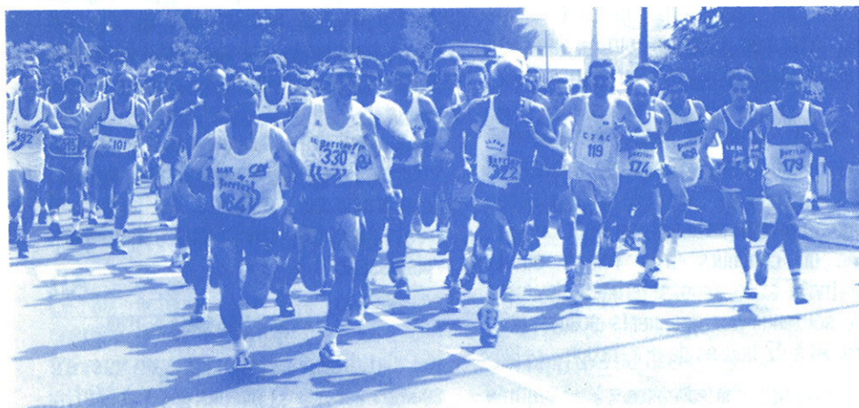
DEPART DU 1ER TOUR DE SAINT-JOSEPH

- Si vous êtes licenciés ALPAC dans une discipline gymn. entretien, hand, tennis, foot, vous pouvez participer dans les épreuves cross ou courses sur route sous le titre ALPAC. Prévenez les responsables qui vous inscriront.