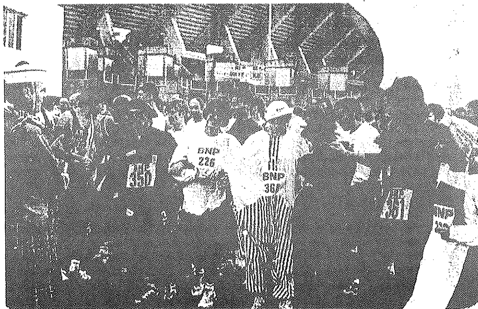
C'est la seule fois de l'année où il est autorisé de courir déguisé. Certains en ont largement profité.

Devant le succès grandissant, la Section Cross de l'ALPAC se doit de répondre à tous les détails d'organisation de cette épreuve qui clôture le calendrier des courses hors-stades. ■